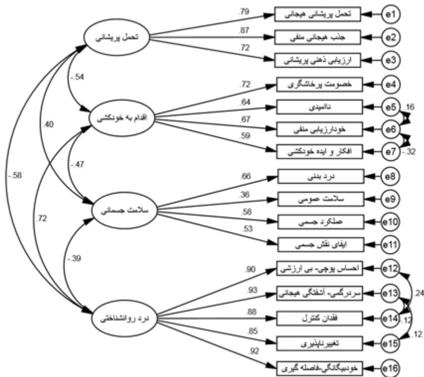
شکل ۲ مدل اندازه‌گیری متغیرهای پژوهش

در ادامه مدل ساختاری پژوهش بر اساس مدل اندازه‌گیری اصلاح شده، اجرا شد. شاخص‌های برازندگی الگوی ساختاری مدل پیشنهادی پژوهش در جدول ۴ نشان داده شده‌اند.