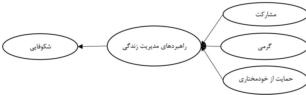
شکل ۱. نمودار الگوی مفهومی شکوفایی در پیش‌بزرگسالی

مطالعه قرار داده است. اما تحولات فرهنگی و اجتماعی جوامع و ظهور دوره تحولی جدیدی به نام پیش‌بزرگسالی (حجازی و همکاران، ۱۳۹۸)، بیانگر لزوم توجه و بررسی عوامل مرتبط با شکوفایی در این دوره تحولی است.